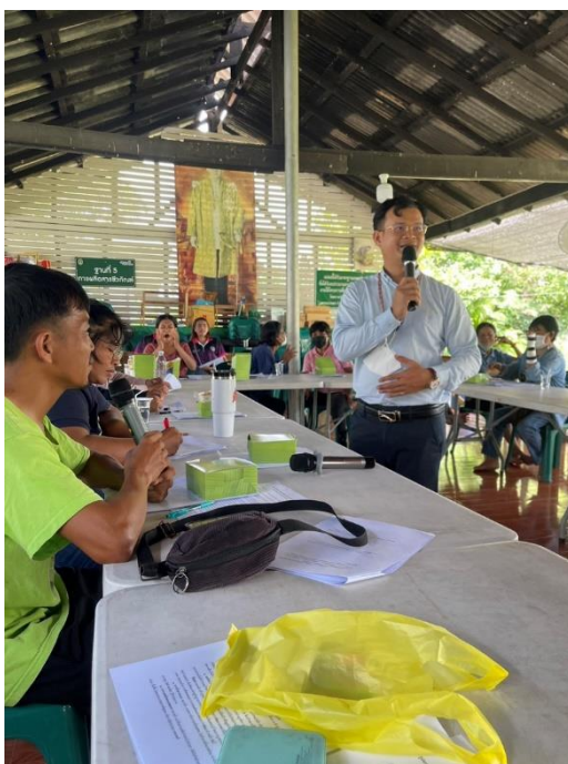
ภาพที่ ๔.๒ กิจกรรมสัมมนาเชิงปฏิบัติการเกษตรอินทรีย์