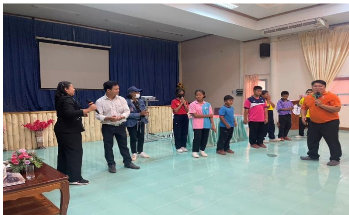
ภาพที่ ๔.๑ กิจกรรมพัฒนานักเรียนเกษตรอินทรีย์

เพียรอันชอบธรรม (๙) สติ มีสติ ระลึกรู้ตัว ใช้ชีวิตด้วยความไม่ประมาท (๑๐) ปัญญา มีปัญญารอบรู้ สิ่งต่าง ๆ อย่างลึกซึ้ง เข้าใจทุกสิ่งตามความเป็นจริง ๑๑