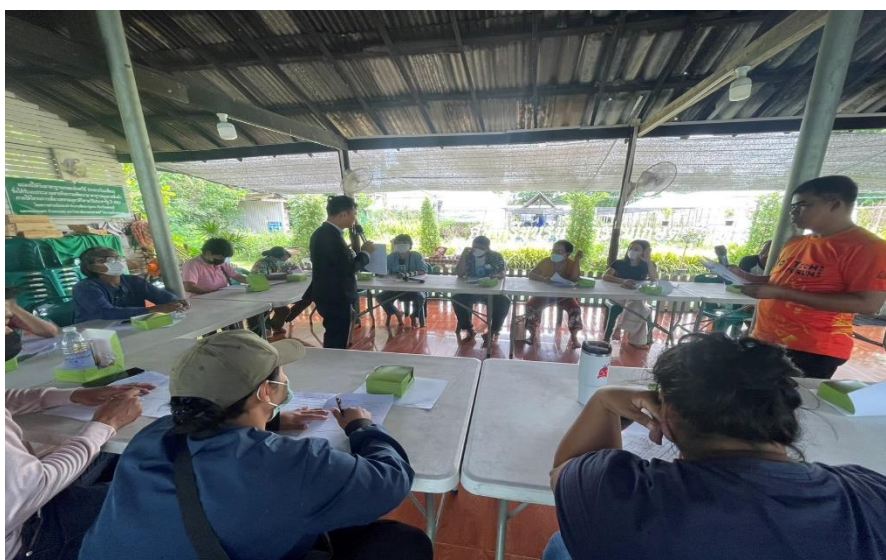
ภาพที่ ๔.๓ กิจกรรมแลกเปลี่ยนเชิงปฏิบัติการ

ระบบนิเวศ พร้อมทั้งเกิดการพัฒนาจิตและสังคมได้อย่างยั่งยืน ๓๒ เกษตรกรมีการรับรู้ถึงการเปลี่ยนแปลงการเกษตรที่เกิดขึ้นในประเด็นการพึ่งพาปัจจัยภายนอกมากขึ้นผลผลิตเกษตรปนเปื้อนสารเคมี และสิ่งแวดล้อมเสื่อมโทรม รวมถึงวิถีชีวิตของเกษตรกรที่ให้ความสำคัญกับเงินมากกว่าคุณภาพชีวิต โดยกระบวนการมีส่วนร่วมในการจัดทำแผนพัฒนาการเกษตรมี ๔ ขั้นตอน ได้แก่ (๑) ร่วมคิด (๒) ร่วมวางแผน (๓) ร่วมดำเนินงาน และ (๔) ร่วมประเมินผล ทำให้เกิดแผนพัฒนาการเกษตรซึ่งประกอบด้วย ๖ โครงการ สำหรับเงื่อนไขของการมีส่วนร่วมของเกษตรกรโดยพบว่ามี ๔ เงื่อนไขที่สำคัญ ได้แก่ (๑) ผู้นำชุมชนหรือแกนนำชุมชน (๒) กระบวนการขับเคลื่อนโครงการพัฒนาภายในชุมชน (๓) การแลกเปลี่ยนเรียนรู้จากประสบการณ์ของชุมชนอื่นและหน่วยงานภายนอก และ (๔) ทัศนคติของเกษตรกรภายในชุมชนที่มีต่อกระบวนการมีส่วนร่วมในการจัดทำแผนพัฒนาการเกษตร ๓๓