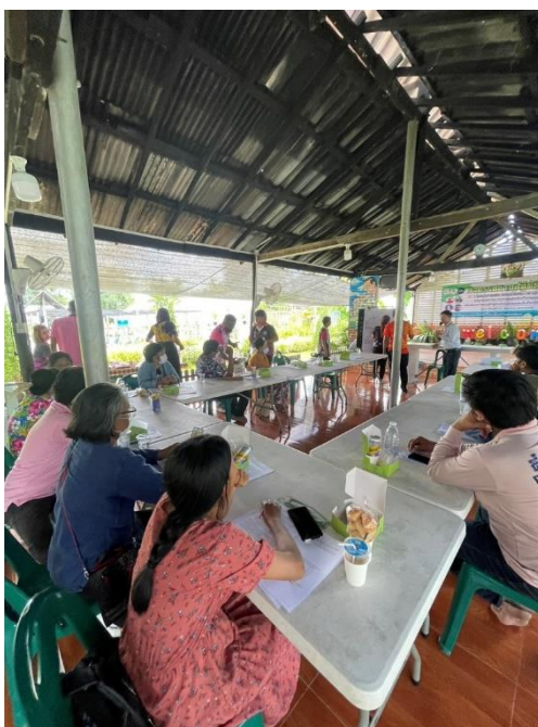
ภาพที่ ๔.๔ กิจกรรมการวิเคราะห์สอร์อา (SOAR Analysis) การพัฒนาเกษตรวิถีพุทธ

๘) สร้างภาคีเครือข่าย “บวร” แปลงสาธิตเกษตรอินทรีย์ รมรณรงค์ลดการใช้ สารเคมีในกลุ่มเกษตรอินทรีย์ การลดใช้สารเคมีและส่งเสริมเศรษฐกิจพอเพียงในโรงเรียนทุกแห่ง โครงการเฝ้าระวังน้ำดื่มคุณภาพ การตรวจตลาดเพื่อเฝ้าระวังคุณภาพอาหาร การตรวจคุณภาพอาหาร กลางวันโรงเรียนและศูนย์พัฒนาเด็กเล็ก รณรงค์การถวายภัตตาหารพระภิกษุลดหวาน มัน เค็ม/ น้ำอัดลม, บุหรี่ (ปิ่นโตสุขภาพ)