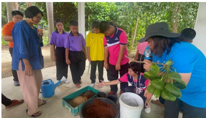
ภาพที่ ๔.๕ กิจกรรมผสมดินและปลูกพืชตัวอย่าง

ปัจจุบันที่คฤหัสถ์พึงถือเอามาปฏิบัติในการทำงาน คือ มีความพากเพียร ขยัน ไม่เกียจคร้าน รู้จักรักษา และปกป้องดูแลกิจการที่ตนดำเนินการอยู่ให้ปลอดภัย หรือมีภูมิคุ้มกันที่ดี ผู้แนะนำที่ดี และรู้จักใช้จ่ายทรัพย์ในการดำเนินชีวิตอย่างเหมาะสม มีหลักสำคัญ ๕ ประการ คือ ด้านจิตใจ เป็นที่พึ่งของตนเอง ด้านสังคม ช่วยเหลือเกื้อกูลกัน ด้านทรัพยากรธรรมชาติและสิ่งแวดล้อม ใช้และจัดการอย่างฉลาด ด้านเทคโนโลยีและด้านเศรษฐกิจ ลดรายจ่าย เพิ่มรายได้และยึดหลัก พออยู่ พอกินพอใช้ โดยนำหลักธรรมมาประยุกต์ใช้กับการแก้ปัญหาการเกษตรเชิงเดี่ยว มาเป็นการทำเกษตรแนวพุทธ เพื่อให้เกษตรกรชุมชนมีความเข้มแข็ง และสามารถพึ่งพาตนเองได้อย่างยั่งยืนและถาวรต่อไปได้ ๔๗ เราสามารถวางกรอบรูปแบบการดำเนินงานของกลุ่มให้อยู่ในรูปแบบเกษตรอินทรีย์วิถีพอเพียงตามวิถีพุทธ ผ่านการบริหารกลุ่ม เท่ากับว่าสมาชิกก็ต้องบรรลุเป้าหมายไปด้วยกัน บนพื้นฐานเดียวกันได้ ๔๘